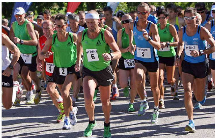
Der 16. Gamperner Lauf bringt am 8. September die Entscheidung in der Willi's Sportshop Runningtour.